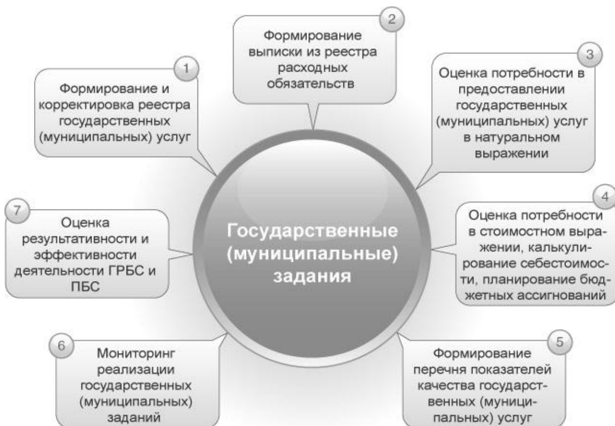
Рис. 1 Схема процесса управления муниципальными заданиями

Основные методические моменты процедур планирования, мониторинга и оценки результативности реализации муниципальных заданий, положенные в основу Программного модуля «Государственное (муниципальное) задание», соответствуют бюджетному законодательству РФ и включают: